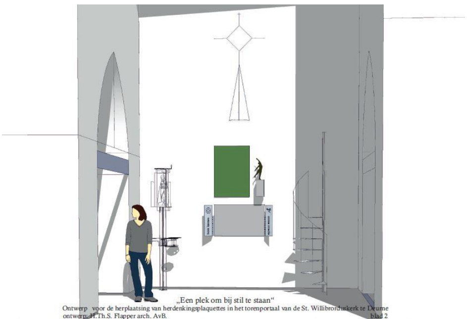
„Een plek om bij stil te staan“ Ontwerp voor de herplaatsing van herdenkingsplaquettes in het torenportaal van de St. Willibrorduskerk te Deurne ontwerp: H.Th.S. Flapper arch. AvB. blad 2

Architect Hans Flapper heeft een ontwerp gemaakt om deze drie objecten bij elkaar te brengen.